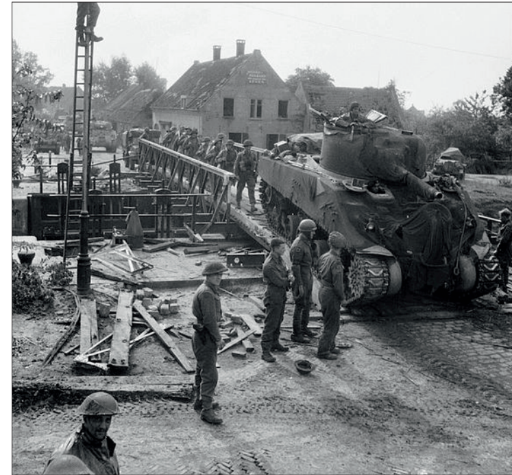
Een Sherman tank en infanterie van 11th Armoured Division passeren Sluis 11 op 24 september 1944.

Een brug, vermoedelijk over de Sterkselse Aa, stortte door het zware verkeer in, maar de opmars werd via een alternatieve route voortgezet. Via de Vaarselstraat en de Speelheuvelstraat werd vlak voor het donker op de 20ste Someren door de eerste troepen bereikt. Een aantal Duitsers met panzerfausten had op de Markt in Someren een kanon opgesteld; dat werd echter volledig door de Britten genegeerd en zij wisten zich later over Sluis 11 terug te trekken. De infanteristen van het Herefordshire Regiment, die achterop de tanks van de Fife and Forfar mee reden, deden een poging om de brug bij Sluis 11 in handen te krijgen, maar deze werd vlak voor aankomst door de Duitsers opgeblazen. De opmars liep zowel over de Kanaalstraat als de parallel gelegen Schoolstraat. Indertijd begon de Schoolstraat bij de Speelheuvel, waar nu de Avennelaan loopt. Het waren dan ook huizen aan deze twee straten die het moest ontgelden tijdens de bevrijdingsdagen.