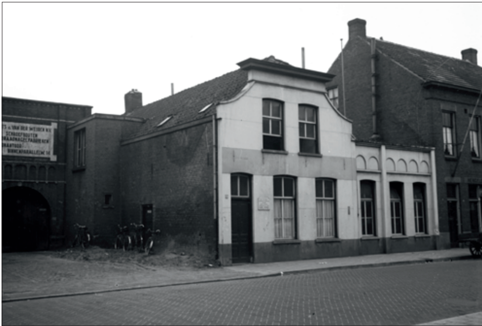
Op het adres Weg op den Heuvel 37 was aanvankelijk het gebedshuis van de Gereformeerde Gemeente gevestigd, waarvoor op de Kromme Steenweg een nieuwe kerk werd gebouwd. In 1898 werd het pand verworven door de firma Everts en van der Weyden, die er een smederij in onderbracht. Later was er Drukkerij Royakkers gevestigd.

tot Evangelisatie , nadat daartoe in 1885 een bouwvergunning was ontvangen. Bij het gebedshuis verrees ook een woning voor de predikant of voorganger. Toen de vereniging ophield te bestaan, behoorde het aan God gewijde gebouw tot het goed van de Vereniging de kerkelijke kas , die de Nederduitse Gereformeerde Kerk bestuurde.