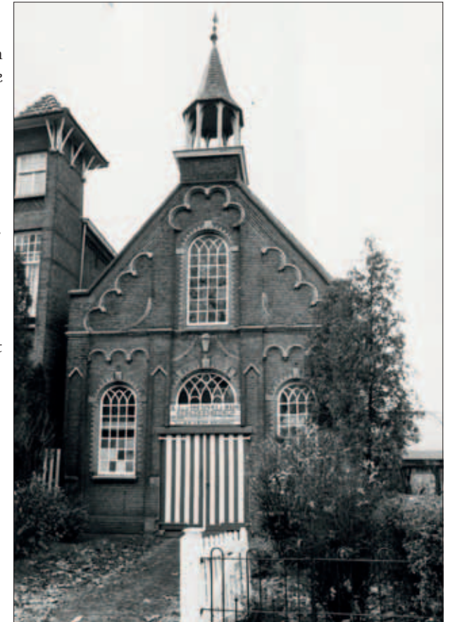
Het Gereformeerde kerkje aan de Kromme Steenweg werd in 1960 buiten gebruik gesteld en in 1981 gesloopt.