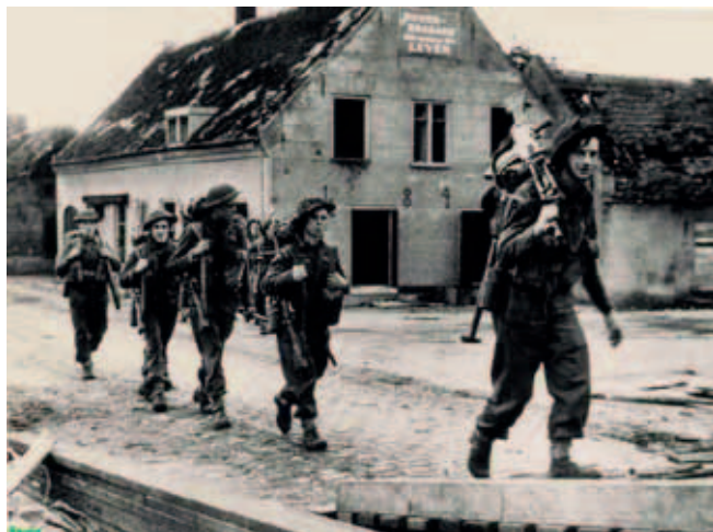
Britse soldaten steken de Baileybrug bij sluis 11 over richting Astens.

De infanterie van het Herefords was om 19:30 uur op de 21ste begonnen met het overzetten van de eerste twee compagnieën om het bruggenhoofd te maken. A en D Company staken het kanaal met aanvalsbootjes over. C Company volgde daarna via de intact gebleven sluisdeuren. Ze werden ondersteund door artillerie die op dat moment een ring vuurde rond het