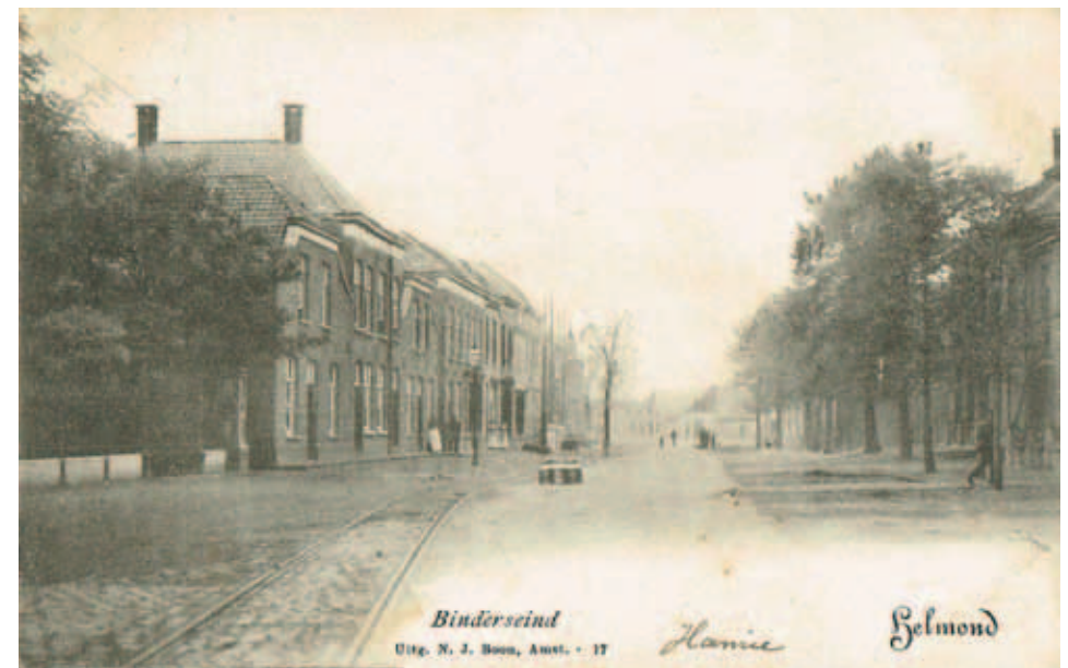
Deze foto is genomen vanaf de plaats waar de Binderschepoort stond.

De Binder- of Binderschepoort wordt eerstens vermeld in een verzoeningsbrief