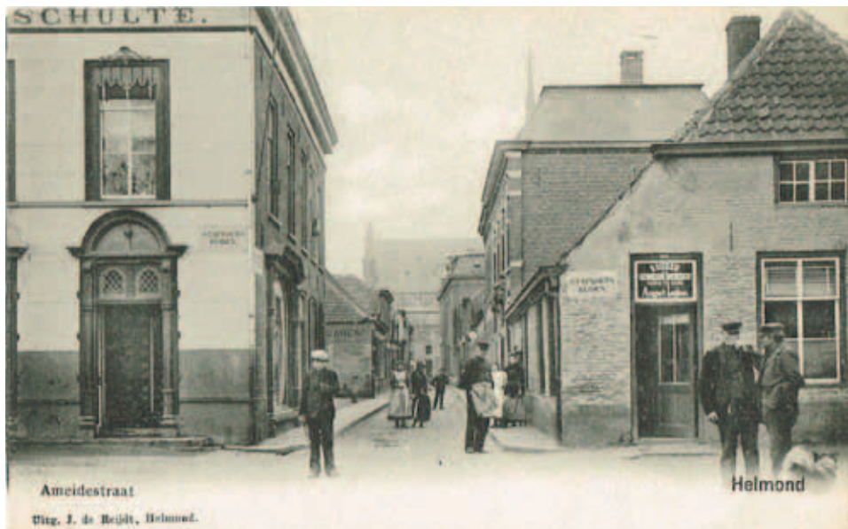
Het nauwe Ameidestraatje werd vroeger afgesloten door de Meijenpoort.

van 19 juni 1419, zij wordt dan ook wel de 'Gasselsmanspoort' genoemd. In latere stukken wordt de toegang consequent de 'Binder- of Binderschepoort' genoemd. De poort stond aan de Binderstraat, ter hoogte van het voormalige postkantoor en het huidige Ameideplein.