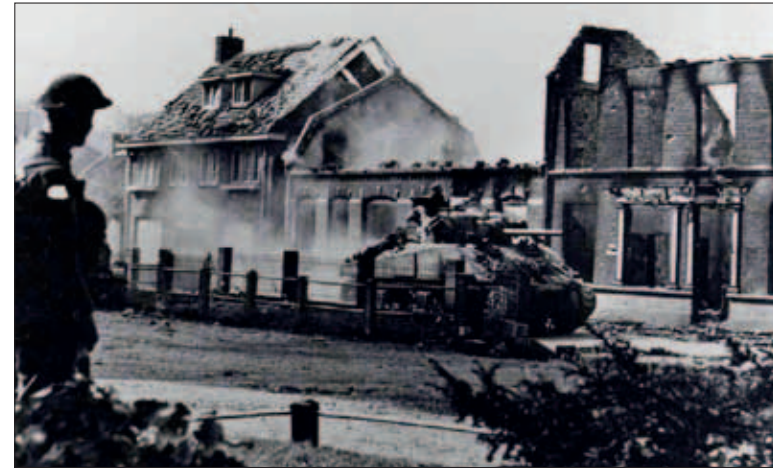
Een Sherman-tank rijdt door de Wilhelminastraat in Asten.