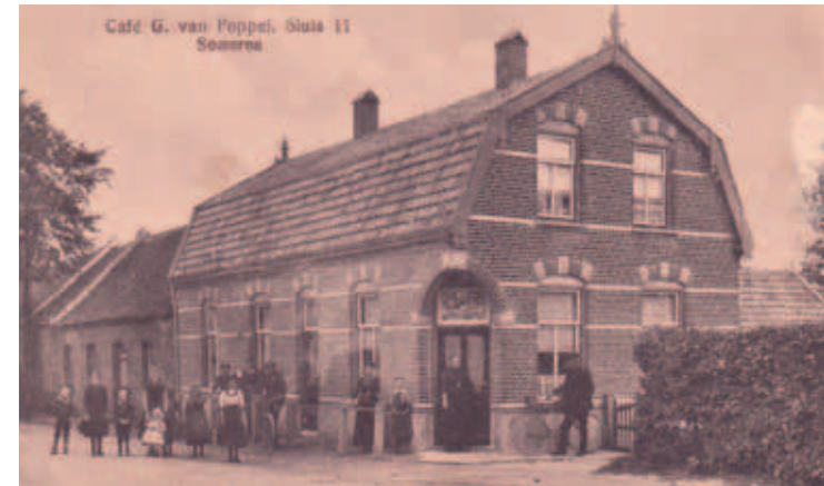
Café Van Poppel aan de oostelijke kant van de Zuid-Willemsvaart, lag tijdens de gevechten in de vuurlinie. Maar het pand overleefde de oorlog en staat er nog altijd.

uitmuntende leiderschap en dapperheid werd Lieutenant Jackson de Distinguished Service Order toegekend. Lieutenant Jackson sneuvelde op 4 april 1945 in Noord-Duitsland en ligt begraven bij Hannover.