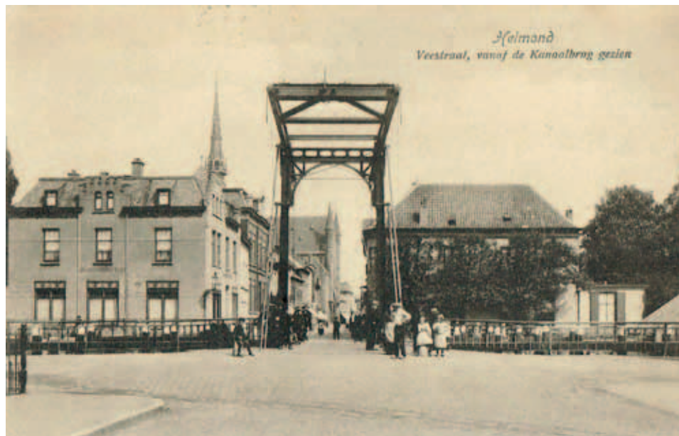
Op de plek van de Veestraatbrug stond ooit de Veeschepoort. Bij de aanleg van de Willemsvaart en de insteekhaven werd een deel van de bedding van de stadsgracht gebruikt.