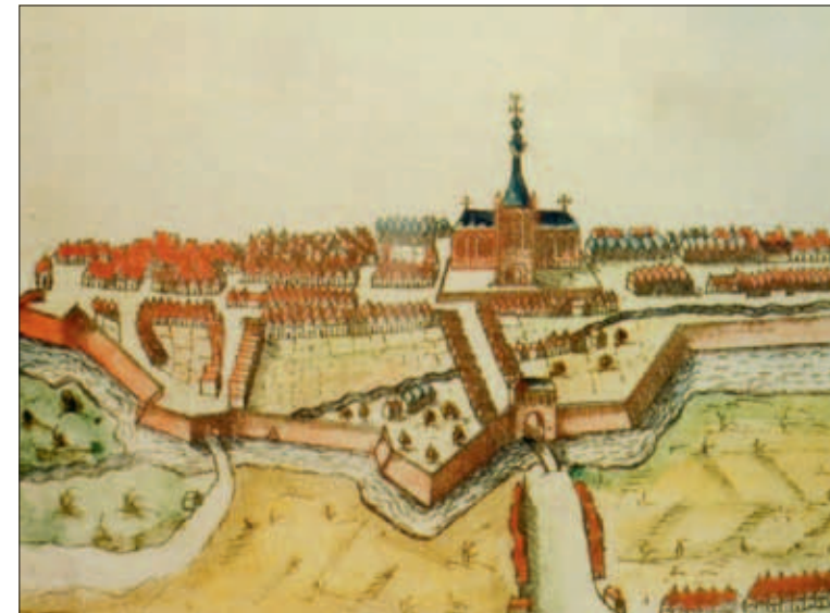
Prent van Ludovico Guicciardini een tekenaar, schrijver en handelaar uit Florence. Links de Waterpoort en op de voorgrond de Veeschepoort. Onder de poort met ophaalbrug.