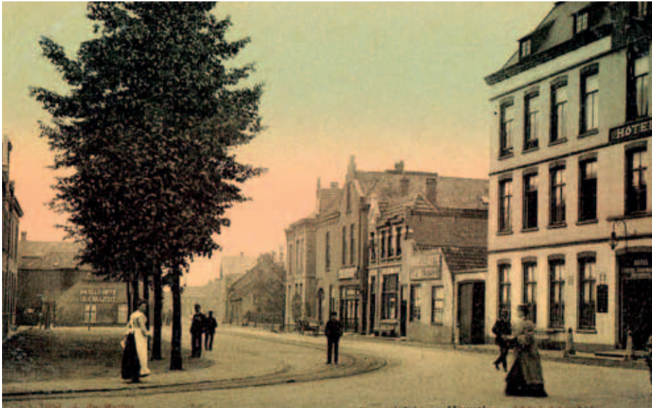
De Hoogeindschepoort bevond zich op de plaats waar de Kerkstraat overgaat in het Beugelsplein.

kasteelpoort gebouwd. Op de plek van beide panden wilde hij een nieuwe vergaderruimte stichten: 'Welverstaende om aen het huys annex te sijn ende te bliven tot gebruyck van den Heere so langhe de porte staen sal' . De betreffende kamer: "Sal men connen gebruycken voor een stadthuys om op te dinghen ende den Raedt daerop te vergaderen, om aldaer de stadtssecreten ende met malacanderen te helpen resolveren' .